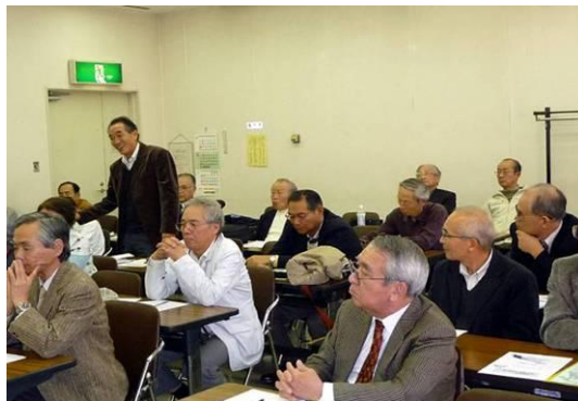
講演会での意見交換の様子

最後の懇親会は、お互い話を始めやすくする手段として参加者全員に10枚の名刺を準備し、名刺交換会としました。懇親会終了までには全部を使い切った多くの人と話し合ってくださいとお願いしましたが、10枚のノルマはかなりきつく何事も目標達成は難しいものだと実感したひと時でした。懇親会には飲み物と軽食を用意しゆっくりお話しいただきました。個人向け交流会にも関わらず団体会員の方にもたくさんご参加いただき、会を盛り上げていただきました。ご協力本当にありがとうございました。