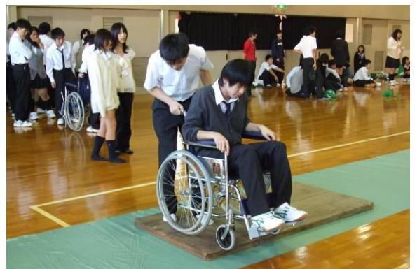
車椅子の体験学習

その体験学習のお手伝いを都教委の委託を受けて行うのが学校教育支援コーディネーターの仕事です。当センターでは今年度市内5つの都立高校において、体験学習のコーディネート業務に携わらせていただいています。具体的には「学習を通して高校生に何を学んで欲しいのか」という先生の目的に沿って効果的な体験学習プログラムを提案し、実施するために地域との連携を企画、調整をすることになります。