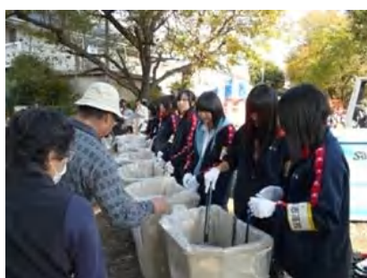
いちよう祭りでのゴミ分別収(八王子桑志高校)