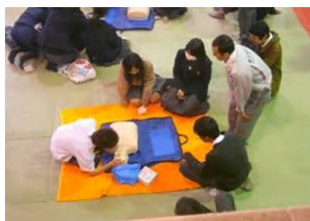
防災訓練学習(片倉高校)

もちろん学校の授業で行うものなので、先生方との連携が重要です。生徒も先生も参加する大人たちも等しく地域の中で共に手を携えているという視点を大切にしたいと思っています。多くの皆様に温かく見守られ、協力していただき感謝しています。