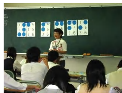
点字学習(八王子東高校)