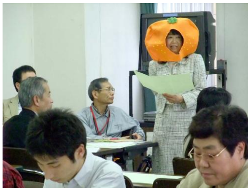
ディスカッション発表