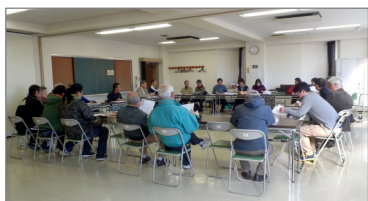
わくわく広場実行委員会風景

また、今年の「わくわく広場」のテーマ「体験」をポイントとした子どもたちのスタンプラリーも行い、景品の「宝引き」も好評でした。余剰金の一部を今年も東日本大震災の義援金とさせていただきます。