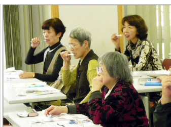
口腔ケア講習の様子