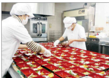
食事宅配サービス部門

もともと地域に根差した地域のためのNPOを目指してやってきました。いま一度原点に立ち返って、地域で困っている人のお役に立てることをやっていきたいと思っています。高齢者に限らず、必要なことを何でも相談していただければと思います。そのためにはできるだけ多くの人に参加いただき、仲間になってほしいと思います。活動の仲間を募っています。ボランティア（有償）として一緒に活動しませんか。