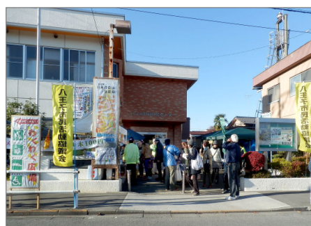
わくわく広場実行委員会本部

~八王子いちようまつりも今年で33回目となりました。平成15年から長房市民センター前と河川敷を利用して参加している「わくわく広場」には、今年も多くの方にご来場いただきました~