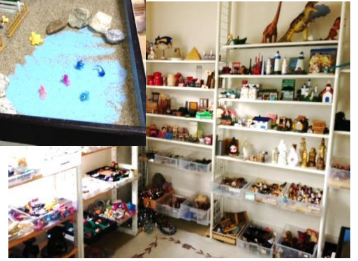
↑ 箱庭体験で 使う箱庭

行ってきましたが、多くの方に箱庭による癒しを体験していただきたいと考え、東京高専サイエンスフェスタやいちよう祭りわくわく広場で箱庭体験を企画しています。心が疲れているとき、砂にふれミニチュアを置くと、日常の慌ただしさに忘れていた大切なものを思い出したり、大切な気づきを得られるかもしれません。10月にはサイエンスフェスタ、11月にはいちよう祭りがあります。ぜひ体験してみてください。出張箱庭体験も行います。病院や高齢者施設などへも出張いたしますのでご相談ください。表情が乏しかった方も、箱庭を作ったあとは明るくなり、感情が動いているのを感じられるそうです。会話がなかった方も、作りながら話し始める方も多いということでした。その他、日常の暮らしの中のカウンセリングにも、全日本カウンセリング協議会認定の心理カウンセラーが対応いたします。お気軽にご相談ください。