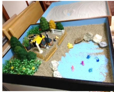
箱庭に使うミニチュア パーツ ↓

「まてりあ」はカウンセラーの資格を持つボランティアの仲間4人で、不登校児の親のための居場所として2002年に活動を始めました。現在では、各種個別カウンセリングを中心に引きこもり・不登校児の自立支援の活動をしています。お伺いした高尾のカウンセリングルームには居心地の良いソファと、壁面には箱庭体験に使うミニチュアパーツが所狭しと並べられていました。「まてりあ」の主な活動の一つに箱庭体験があります。1965年河合隼雄氏によって導入された箱庭療法は、日本においては一般の人のリラクゼーションにも幅広く使われています。「まてりあ」では、引きこもりの児童、青年、保護者の方を対象に箱庭体験を