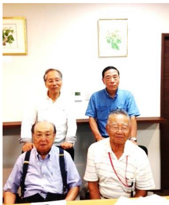
「めじろむつみクラブ」の皆様

めじろむつみクラブ（MMC）はめじろ台2丁目の老人会の有志の方々が中心となり、2002年に設立されました。地元での友愛活動、高齢化対策をテーマに楽しみながら、生きがいを感じながら、互助を実現する事を目的に活動を始めました。具体的には家庭内や日常のお困り事を解決することです。老人会がもととなっている素人集団ですから、設立時の苦労は大変なものでした。設立から10年が過ぎて、現在会員数は130名、利用する人も活動に参加する人も会員登録が