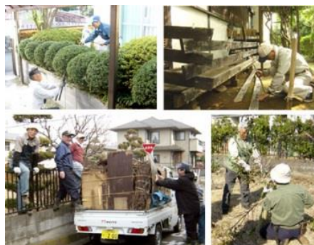
←MMCの活動の様子。軽トラック購入にも苦労話が。

地域の課題は自分たちで解決するという意識で、日々意欲的に楽しそうに活動している「めじろむつみクラブ」（MMC）の皆さんにシニアパワーの頼もしさを感じる訪問でした。