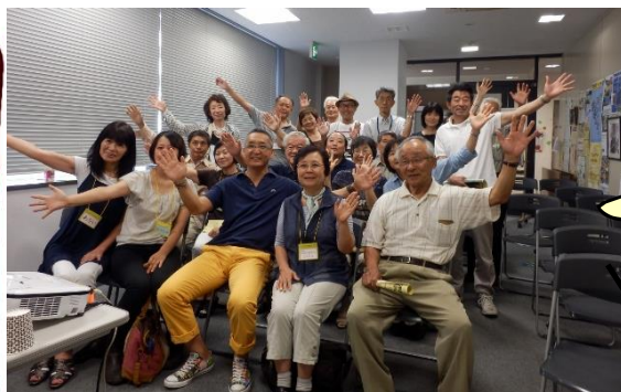
(左・下) 昨年のフェスティバルの様子