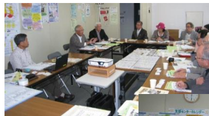
*上尾市から視察研修に来訪された上尾地域活動推進の会の皆様との情報交換の様子