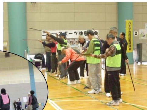
スポーツ吹き矢（上） キンボール（左）